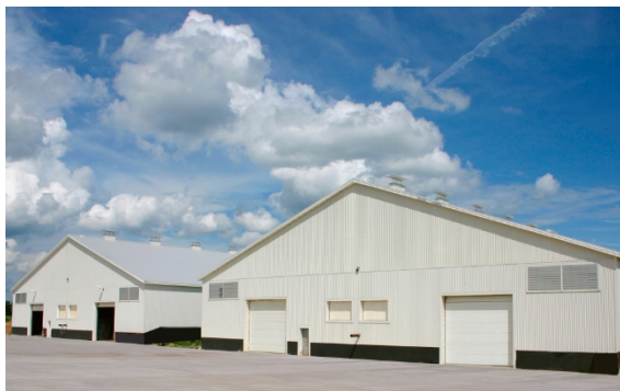
Новый комплекс хранения семян