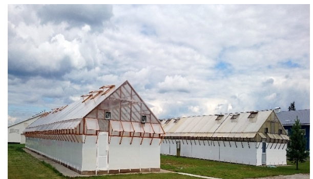
Тепличный гидропонный комплекс