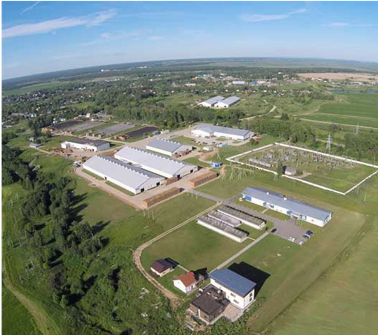
Индустриальный парк «Рогачево»